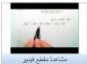
مشاهدة مقطع فيديو

كثيرات الحدود المدى (14:27) المستهدف: شاعر التبراني - مظهره: 24/08/13