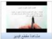
مشاهدة مقطع فيديو

كثيرات الحدود المدى (28:43) المستهدف: شاعر التبراني - مظهره: 23/08/13